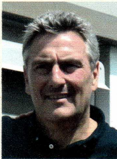
Dieter Müller Ex- Bundesliga und Nationalspieler u.a. OFC u. 1.FC KÖLN